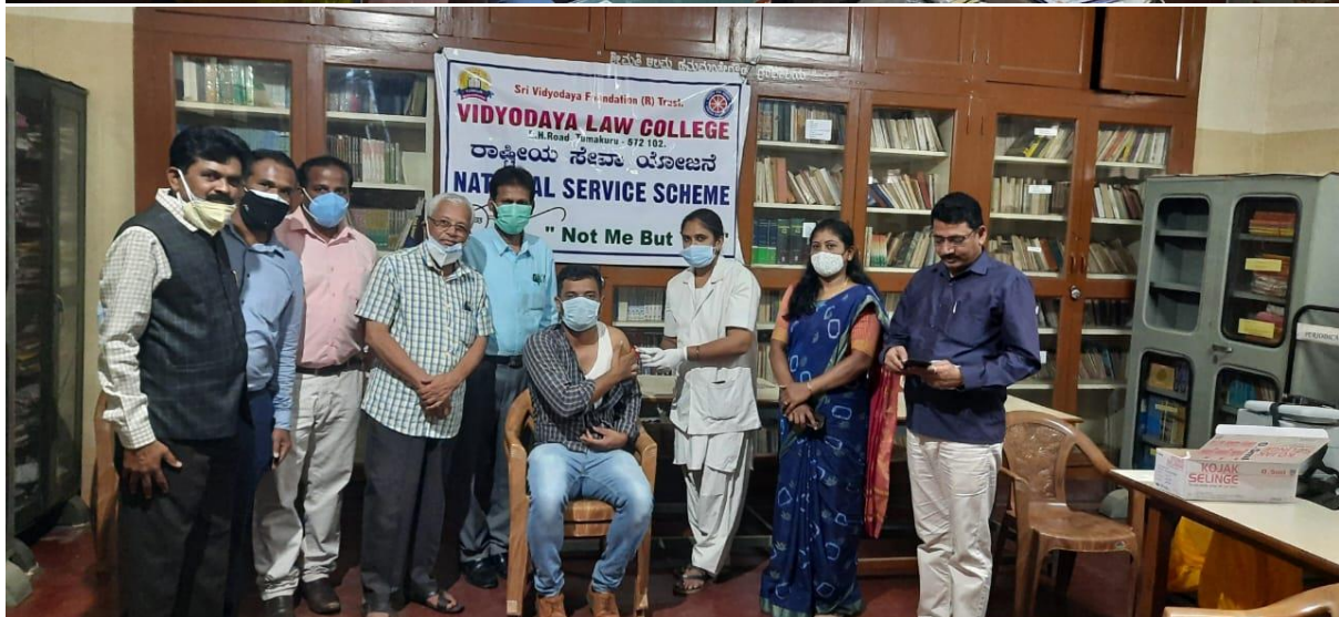
Vaccination Drive program to students, Teachers and Non Teaching Faculties of vidyodaya law college during Covid-19 in college