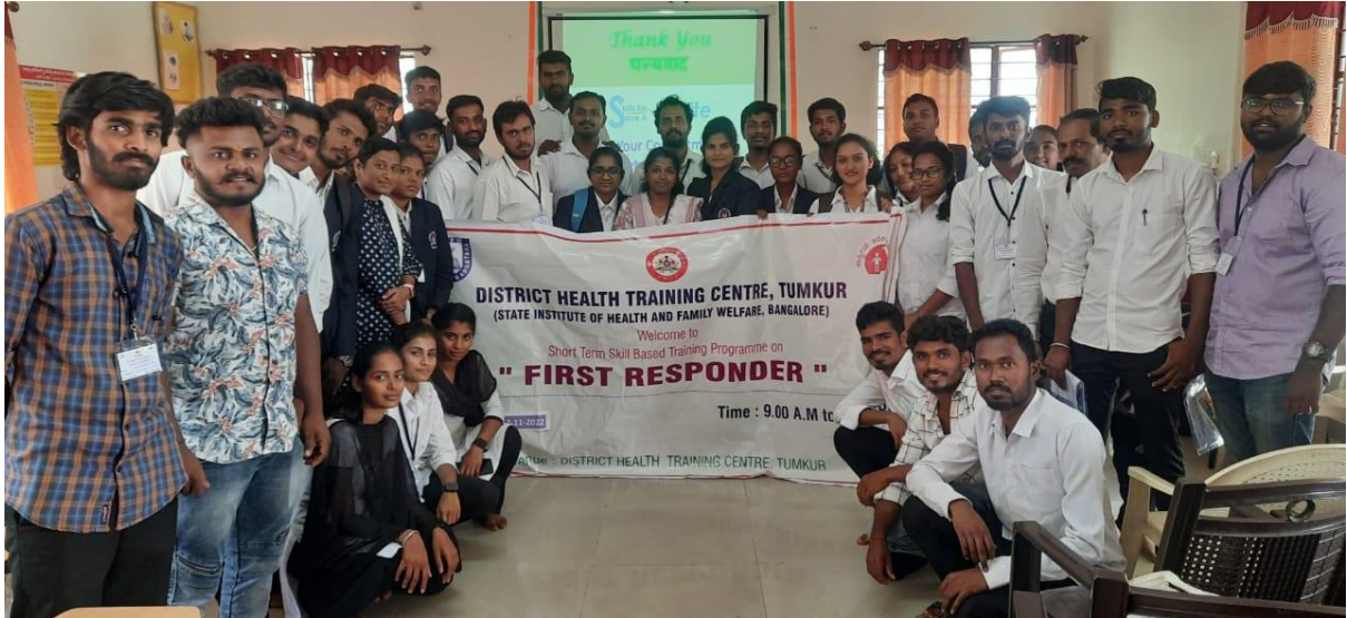
Our college YRC Volunteers participated in First Responder Training program conducted by District Health Training Centre, Tumkur.