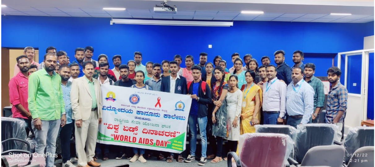
Celebrating WORLD AIDS DAY by YRC Volunteers in college.