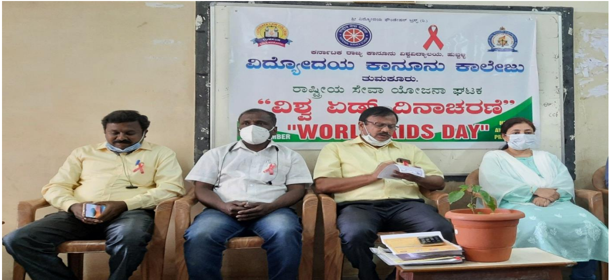
YRC Volunteers Participated in PEER EDUCATOR TRAINING organized by District AIDS Prevention office Tumakuru